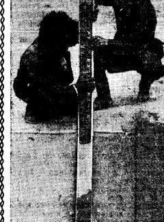
Здесь воды много, но лишней нет. Дорого она достается, ее приходится беречь...